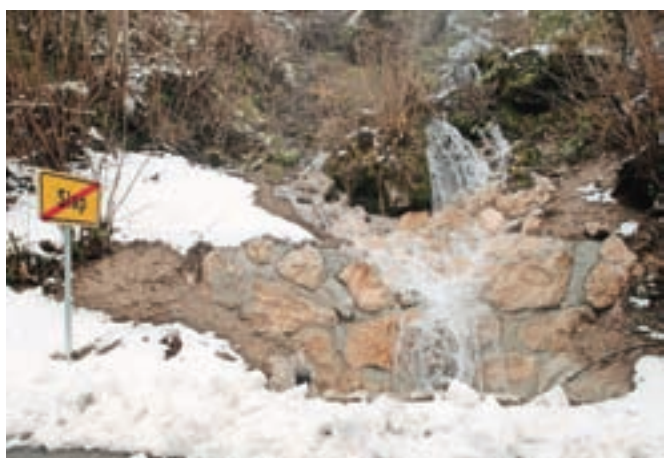
Grabinci so delali v izjemno težkih pogojih.