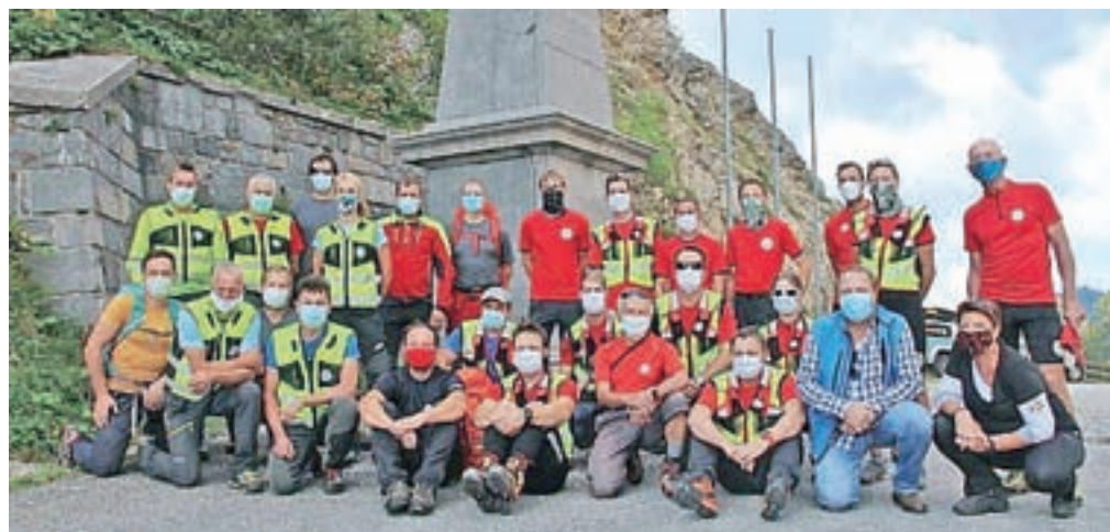
Po skupni vaji s kolegi iz GRS Borovlje. »Za nas in naše poslanstvo ni državnih meja.«

Že vrsto let se ubadamo s težavami glede lastnih prostorov. Sedaj smo tik pred vselitvijo v nove prostore v Pristavi, za kar gre zasluga Občini Tržič, ki je nekdanje prostore Komunale predala v last Upravi za zaščito in reševanje, ki je financirala nujna dela za potrebno funkcionalnost prostorov. Prenova je sedaj že skoraj končana in do božiča se bomo po vsej verjetnosti že lahko vselili v nove prostore, ki nam bodo nudili precej boljše pogoje za delo.