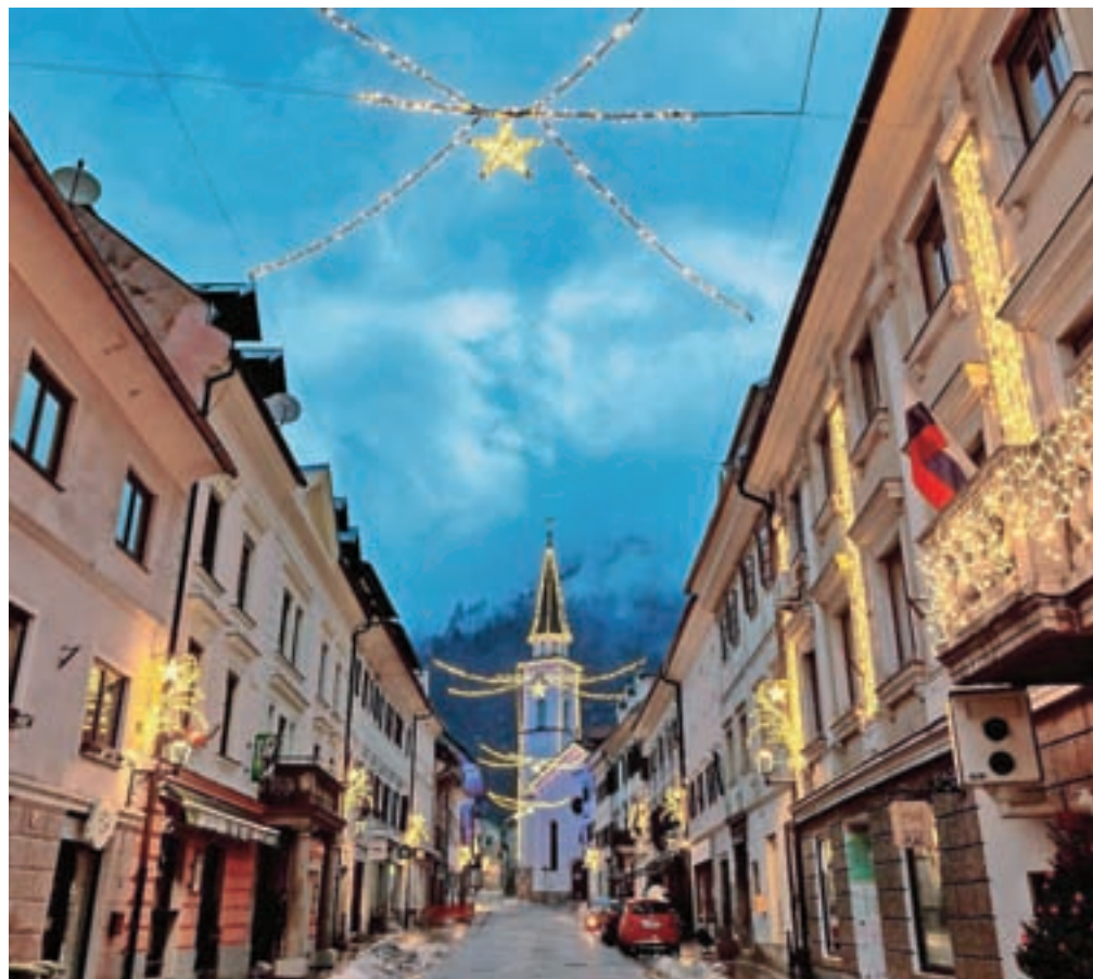
Sprehodite se po novi praznični poti skozi staro mestno jedro Tržiča.

– »Firbc vokna«, ki je v kolektivno zavest zapisano kot okno, skozi katero so imele tržiške gospe pregled nad dogajanjem na ulici, ne da bi jim ga bilo treba odpreti in se skozen tudi skloniti. Njegova zasnova – pomaknjeno je navzven in v spod-