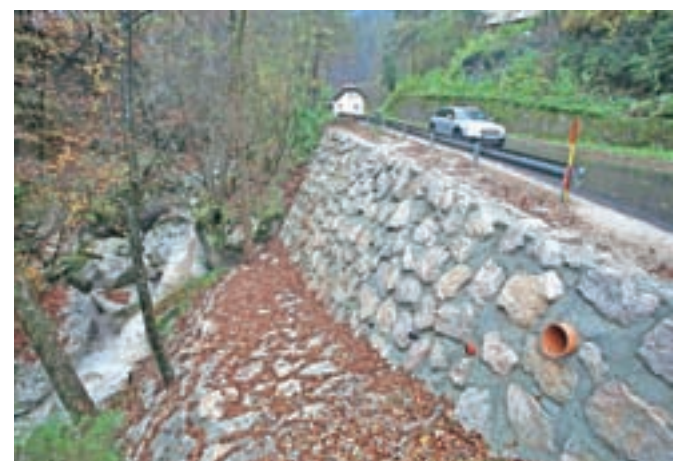
Zavarovana struga Lomščice