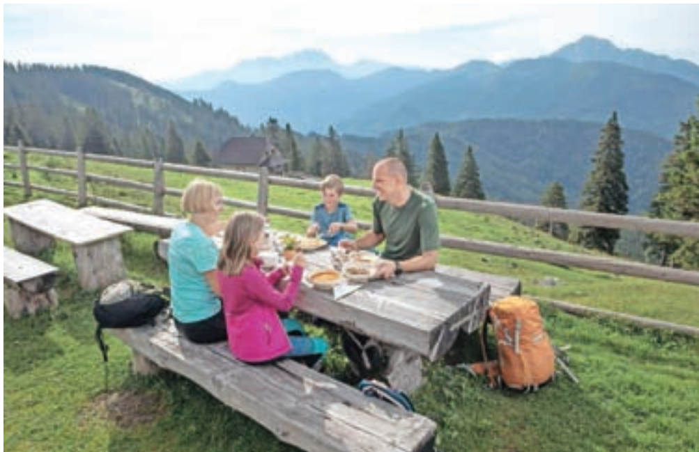
Tudi v letošnjem poletju smo izvajali aktivnosti in ponujali doživetja.

2019. Od januarja do konca oktobra pa je bilo ustvarjenih 13.574 nočitev. Gosti so v Tržiču povprečno preživeli 2,9 dneva, kar je 0,4 dneva več kot v lanskem letu. Kljub omejitvam potovanj je razmerje nočitev med domačimi in tujimi gosti enako, so pa tuji gostje pri nas bivali kar 1,4 dneva dlje kot doma-