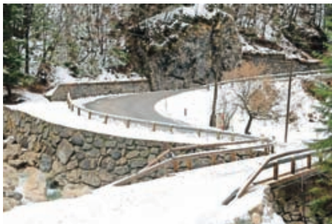
Na novo je urejenih tudi nekaj čez pet kilometrov cest na zahtevnem razgibanem terenu.