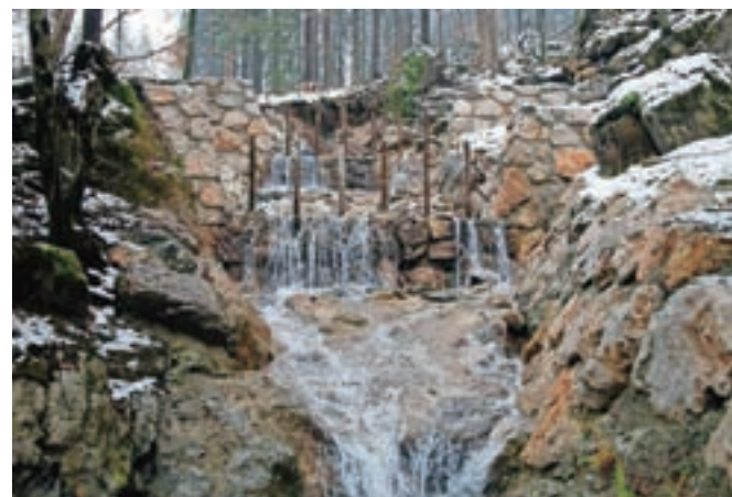
Hudourniški tok, na fotografiji sicer precej miren, v utrjeni strugi

Skupna vrednost celotne sanacije v dveh letih znaša nekaj čez 5,8 milijona evrov, od tega je bilo nepovratnih sredstev države nekaj čez 4,1 milijona evrov in 1,6 milijona evrov občinskih sredstev. "Sanacija se je letos izvajala na devetih odsekih. Obnovilo se je 2,5 kilometra vozišča, celovita sanacija se je izvedla na dveh mostovih (most v Dolini pod RIS-om in na Slapu pred začetkom naselja Čadovlje), most pri Lenartovi domačiji je bil zaradi obsega poškodb v celoti odstranjen in na njegovem mestu zgrajen nov most. Sočasno z obnovo vozišča in premostitvenih objektov so se v strugi Tržiške Bistrice in Lomščice izvajala zavarovalna dela na