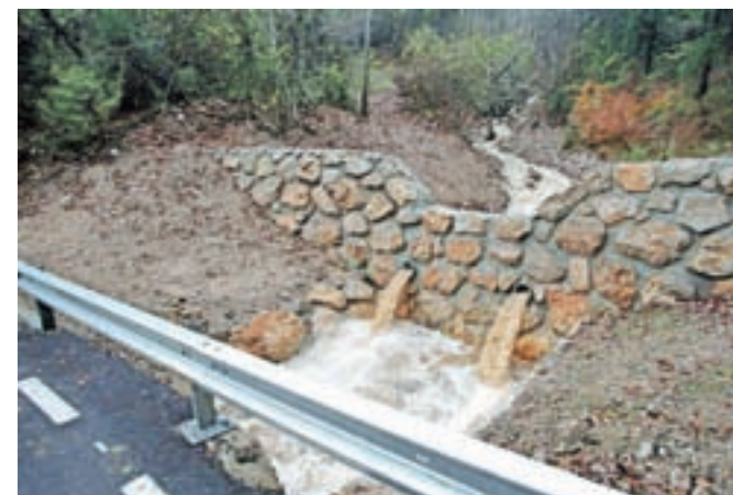
Zaplavna pregrada nad Lomom pod Storžičem s prostornino sedemsto kubičnih metrov