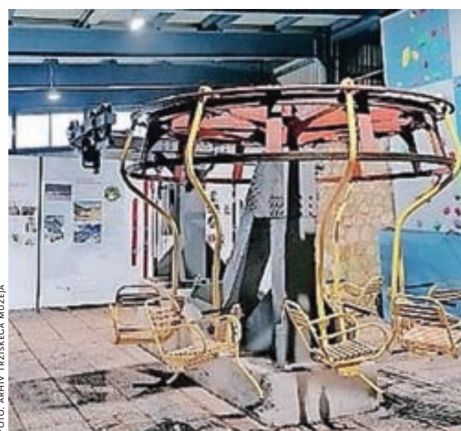
Restavrirani stoli nekdanje žičnice na Zelenici

Zelenica, ena najbolj priljubljenih turističnih destinacij v tržiški občini, ima tako novo stalno razstavo, zunanjo enoto Slovenskega smučarskega muzeja, na kateri je prikazana dolga in zani-