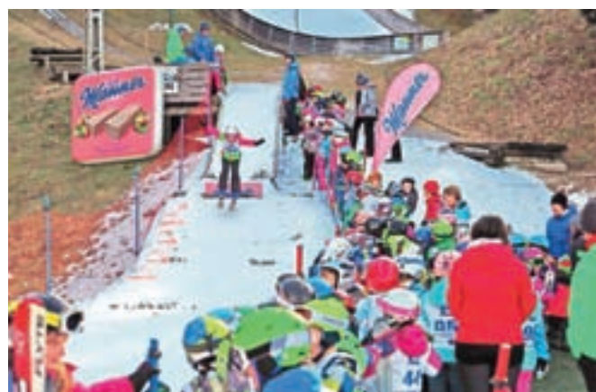
Še naprej si prizadevamo, da bi v svoje vrste privabili čim več mladih tekmovalk in tekmovalcev.

mlajše kategorije, od cicibanov in vse do kategorije deklic in dečkov do 13 let. Za več informacij o tem, kdaj bodo potekali dogodki za naše najmlajše člane, pa ob sprostivni ukrepov lahko pokličete na telefonsko številko 041 749 505 (Viko). V skakalnem centru se lahko pohvalimo tudi s prenovljeno vlečnico, na kateri potekajo še zaključna dela. Nova pridobitev nam bo še lažje omogočila izvedbo tekmovanj in predvsem pomaga pri izvedbi vsakodnevnih treningov. Ob tej priložnosti bi se tudi radi zahvalili Občini Tržič, Fundaciji za šport in Smučarski zvezi Slovenije, brez katerih izvedba štiri-deset tisoč evrov vrednega projekta ne bi bila mogoča.