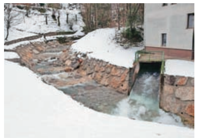
Urejeno je tudi odvodnjavanje.