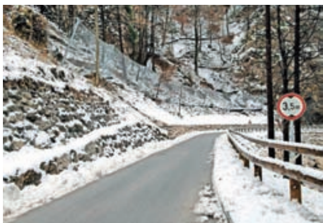
Nove pločnike za varnejšo pot pešcev je pobelil prvi nedavni sneg.