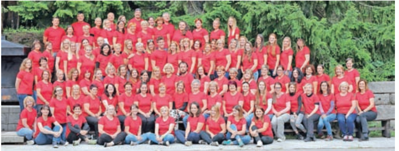
Kolektiv Vrtca Tržič junija letos

zbor vrtca še nikoli ni štel toliko članov kot tokrat, spesnili in uglasbili smo celo svojo novo himno. Prireditev je bila načrtovana za sredino aprila, pospremila pa bi jo pestra razstava v Galeriji Atrij Občine Tržič. Ob koncu februarja smo ugotavljali, da načrtovanje takšne prireditve in razstave nikakor ni mačji kašelj, sploh ker smo v pripravo vključili starše in seveda otroke, zaposleni pa smo bili vključeni prav vsi do zadnjega. Druge možnosti kot dati vse od sebe sploh nismo videli. In drug drugega smo spodbujali, čeprav se je mnogim poznala sled utrujenosti, saj tudi pri vsakodnevnem delu z otroki velja enako – dajati vse. Finančno nas je tudi za prireditev podprla občina ustanoviteljica, a tudi na poziv sponzorjem se je odzvalo kar nekaj tržiških podjetij. Zahvaljujemo se vsem, z namenom in obljubo, da bomo vse zbrano – četudi bo praznovanje malo