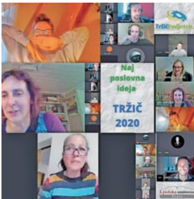
Fotografija s spletnega dogodka Natečaj za naj poslovno idejo Tržič 2020

Pri vključevanju v izobraževanje na daljavo so zabeležili težave pri starejših. "Bodisi ker nimajo dobre računalniške opreme oziroma je sploh nimajo bodisi ker nimajo nikogar, ki bi jim pri tem pomagal. A po drugi strani opažamo, da se je v jesenskem zaprtju opogumilo več starejših, ki že zelo spretno uporabljajo videokonferenčne aplikacije, tudi zato, ker drugih možnosti ni, razvoj digitalizacije pa gre hitro naprej," je pojasnila Brum-