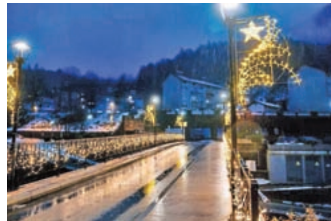
Praznično žarijo tudi vsi trije mostovi čez Tržiško Bistrico v Tržiču.