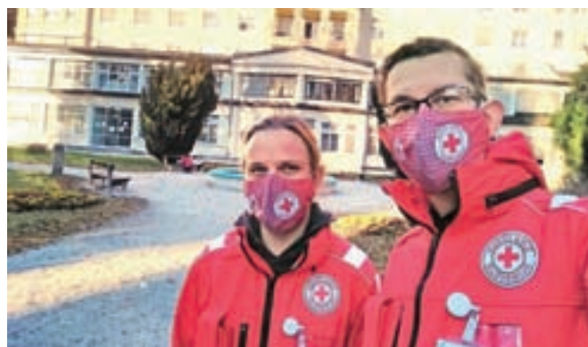
Prostovoljci, člani ekipe prve pomoči, že od 30. oktobra pomagajo na covidnem oddelku na Kliniki Golnik.

Tržič, Golnik – »Čuj mojo skrivnost. Zelo preprosta je: kdor hoče videti, mora gledati s srcem. Bistvo je očem nevidno.« (Antoine de Saint-Exupéry: Mali princ). Člani ekipe prve pomoči Rdečega križa gledamo in delamo s srcem, zato smo se tudi takoj kot prostovoljci odzvali na poziv Civilne zaščite Republike Slovenije za pomoč zdravstvenemu osebju po vsej državi. Ekipe gorenjske regije trenutno pomagamo v Kliniki Golnik na oddelkih, kjer se zdravijo osebe, ki so zbolele zaradi virusa SARS-CoV-2. Poma-