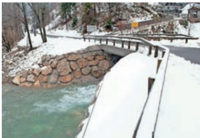
Ob vstopu v Dovžanovo sotesko v Čadovljah je zgrajen eden od šestih novih mostov.