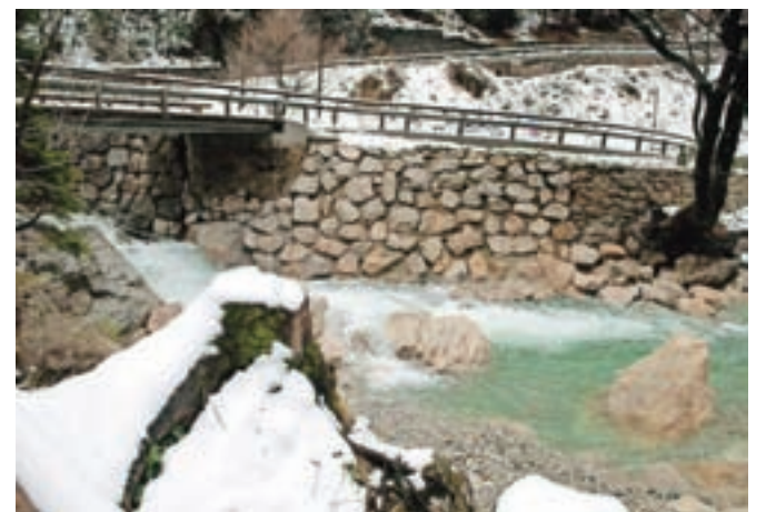
Varnejši je tudi nov Bencetov most v Dovžanovi soteski, v neposredni bližini je urejeno parkirišče.