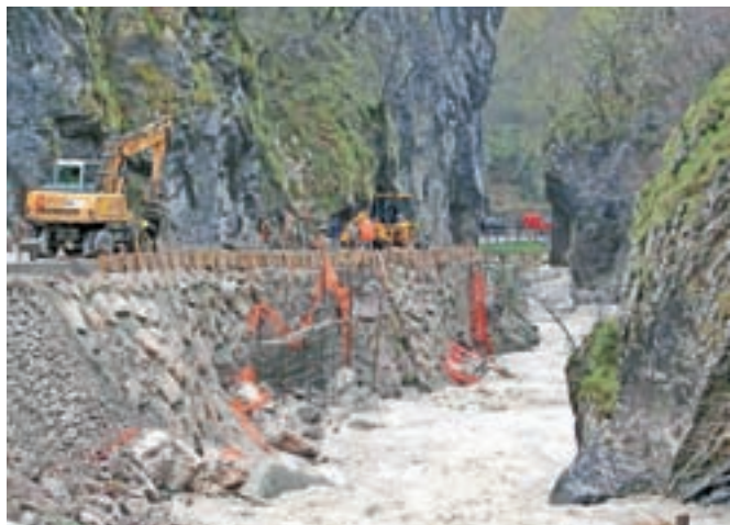
Izvajalci del so nad Tržiško Bistrico zgradili podporne konstrukcije in na novo uredili cesto skozi Dovžanovo sotesko.