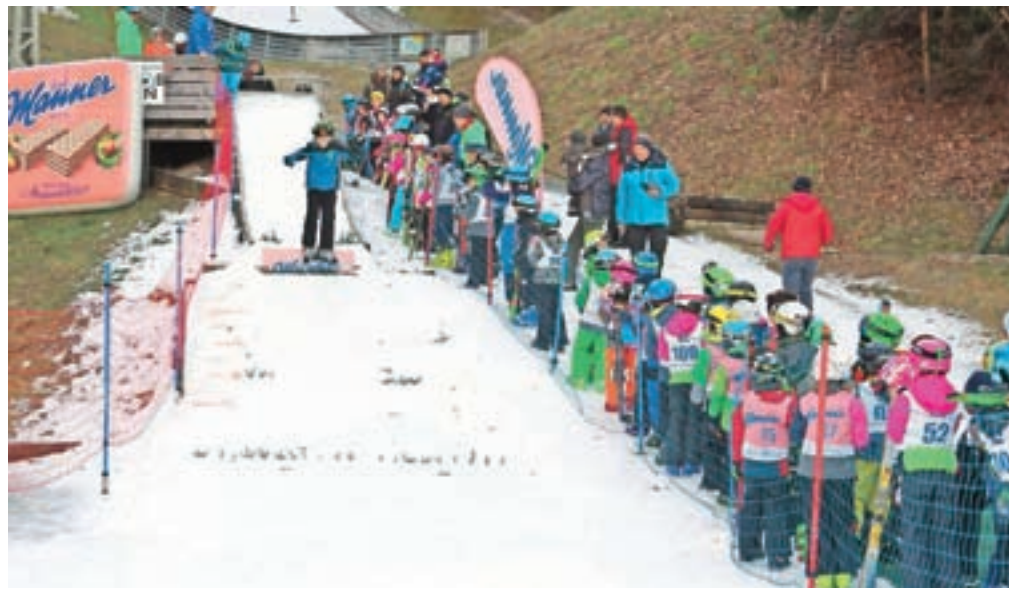
S smučarskimi skoki se bolje lahko spoznate tudi na treh dogodkih, ki jih bo klub organiziral v zimski sezoni.

Sebenje – Nordijski smučarski klub Tržič FMG se tudi v teh neprijetnih časih trudi in kar se da dobro skrbi za svoje člane. Dela in aktivnosti v klubu ne manjka, še naprej si prizadevamo, da bi v svoje vrste privabili čim več mladih tekmovalk in tekmovalcev. Zaradi ukrepov, ki ta čas veljajo po vsej državi, ne moremo natančno napovedati dogodkov, ki bi jih radi izpeljali z našimi najmlajšimi člani. Smo pa v klubu pripravljeni, da v letošnji sezoni izpeljemo številne dogodke, s katerimi bi smučarske skoke približali novim tekmovalcem, vse to pa bi predstavili na kar se da zabaven način. V načrtu imamo, da bi novim članom in članicam skoke predstavili tudi skozi tečaj alpskega smučanja, seznanili bi jih s tekom na smučeh, vedno pa