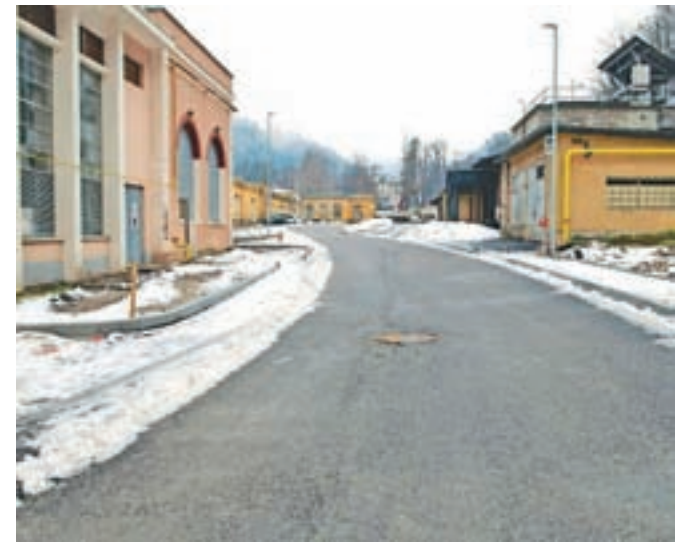
Občina Tržič v kompleksu BPT ureja tudi komunalno in cestno infrastrukturo.

drugem delu, ki prav tako že poteka, bo Občina omogočila pogoje za zasebne investitorje z zagotovitvijo komunalne opremljenosti in cestne oz. prometne infrastrukture. Dveletni projekt bodo v delu, ki je v pristojnosti Občine, zaključili predvidoma do prvega maja 2021. "Na območje BPT je že zdaj vezanih več kot 15 podjetij, več kot petdeset delovnih mest, zraven pa še atraktivne vsebine, kot je najdaljše zaprto strelišče v državi in notranji poligon, t. i. skate park. Tudi prostora za nove obrtnike in podjetnike je še zadosti," je povedal župan Občine Tržič Borut Sajovic in dodal, da je treba zapolniti predvsem prazne prostore v mestu in po drugi strani ohraniti kmetijske površine, ki jih v občini ni veliko.