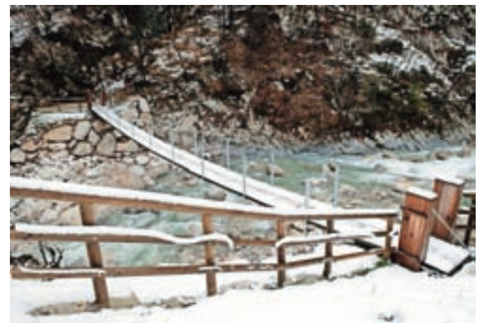
Nova brv za obiskovalce Dovžanove soteske