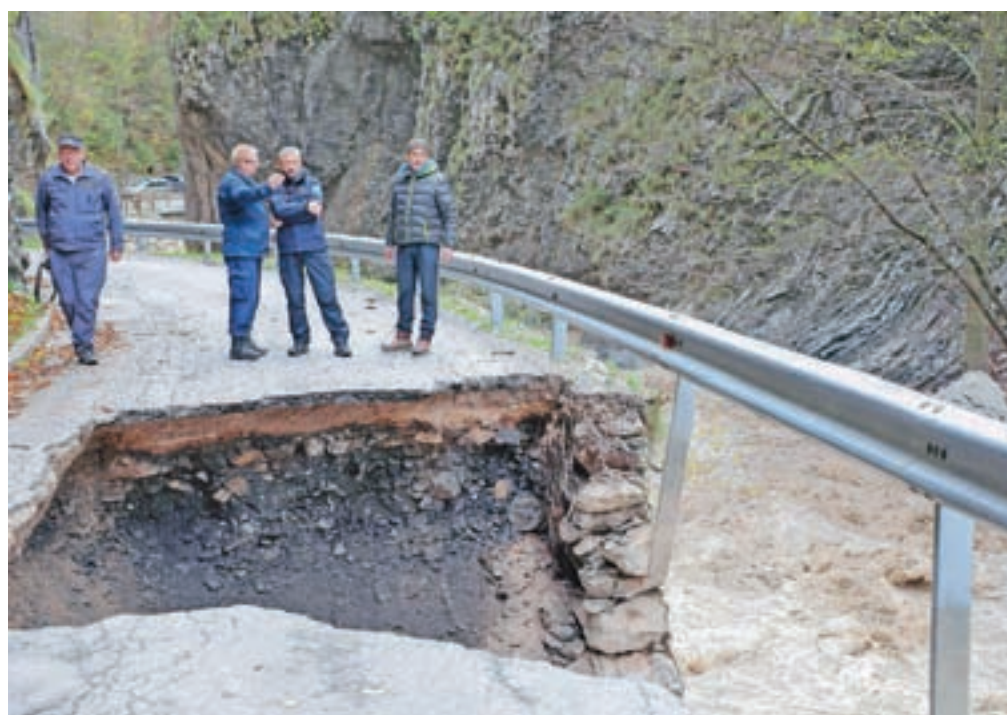
Močno poškodovana cesta skozi Dovžanovo sotesko je prebivalce Jelendola in Doline v ujmi leta 2018 odrezala od sveta.

Hitro in močno narasla Tržiška Bistrica je poplavljala na izpostavljenih območjih, hkrati je s svojimi pritoki zaradi silovitega hudourniškega toka povzročila večjo škodo na vodni in cestni infrastrukturi. Posledice