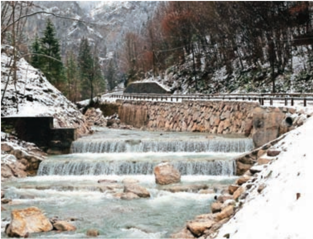
Nove podporne konstrukcije v strugi Tržiške Bistrice

brežinah in vodno gospodarske ureditve. Zgrajenih je bilo približno šeststo metrov podpornih in težnostnih zidov. Na vseh odsekih se je uredilo odvodnjavanje padavinskih in zalednih voda, sočasno se je na nekaterih odsekih izvedla tudi obnova in dograditev gospodarske javne infrastrukture – vodo-