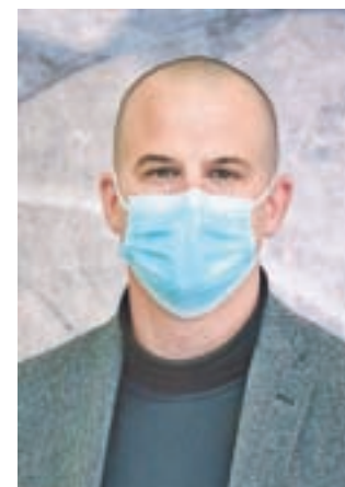
Urban Bole