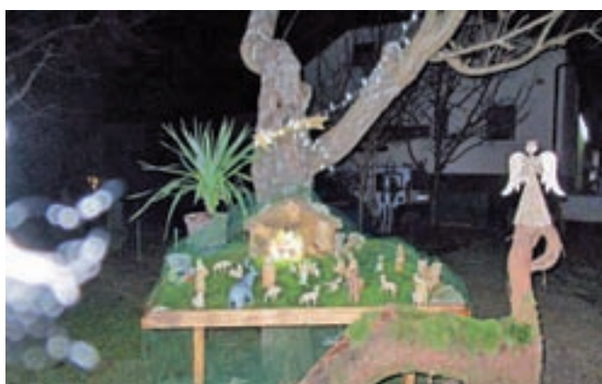
Ulične jaslice še v letu 2019