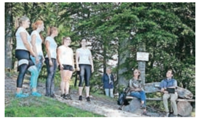
Spominjarije, ki jih tradicionalno prireja Krajevna skupnost Brezje pri Trziču v sodelovanju z Zvezo kulturnih organizacij Trzič in Območno izpostavo JSKD Trzič, so septembra letos prvič potekale pri Poldetovi klopici na Dobrči.