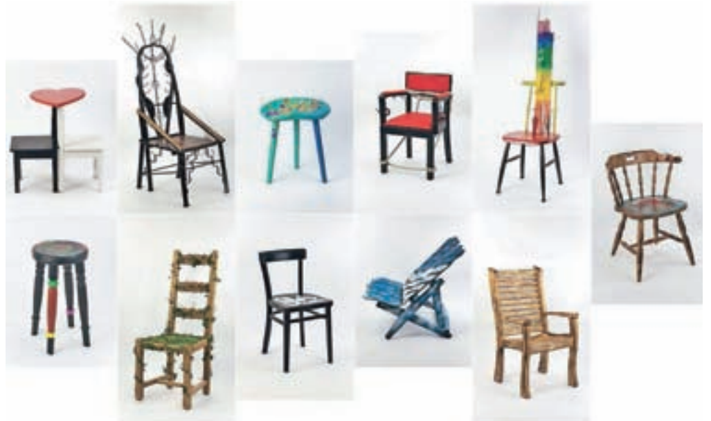
Vsak avtor je k stolu dodal kratek opis na spletni strani nacetapalette.si.