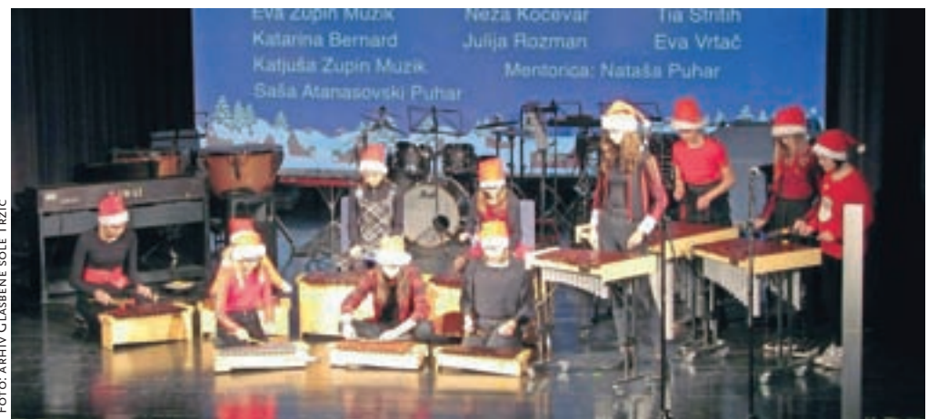
Glasbena šola Tržič v decembru napoveduje virtualne koncerte, ki bodo objavljeni na spletu. Na fotografiji njihova Orffova skupina z lanskoletnega božičnega koncerta.