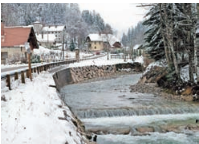
Jelendol v spokoju na začetku decembra 2020