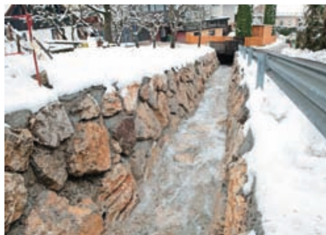
V strugo ograjena Lomščica