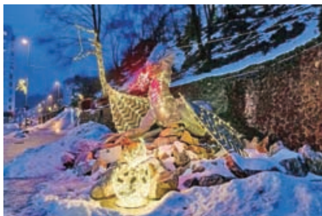
Zmaj iz petelinjega jajca, ki je po legendi neločljivo povezan z nastankom današnjega Tržiča

– Tržiškega muzeja, ki predstavlja nekoč izjemno močno razvite obrti, ki so dajale kruh številnim Tržičanom. V svojo družbo vas vabijo smučarji z Bojanom Križajem na čelu, pa čevljarji, usnarji, nogavičarji in mnogi drugi.