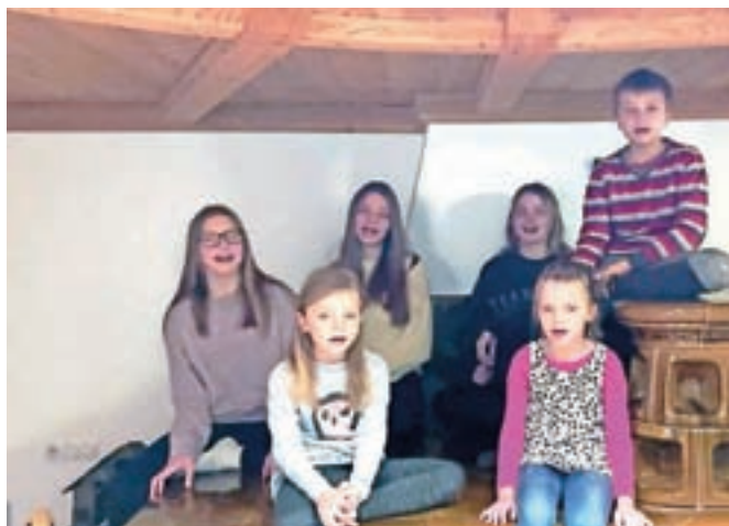
Brat in sestre Šlibar, vsi člani FS Karavanke

koledniškimi voščili, program pa popestrili s predstavitvijo običajev v prazničnem decembru. Adventni čas je poln simbolike, ki jo bodo skozi pesmi in zgodbe približali gledalcem. Po koncertu bodo čestitali še njihovim jubilentom in »podelili« družvena priznanja. Vabijo, da se naročite na njihov kanal na Youtubu in spremljate tudi druge objavljene dogodke.